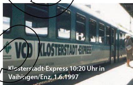
Klosterstadt-Express 10:20 Uhr in Vaihingen/Enz, 1.6.1997