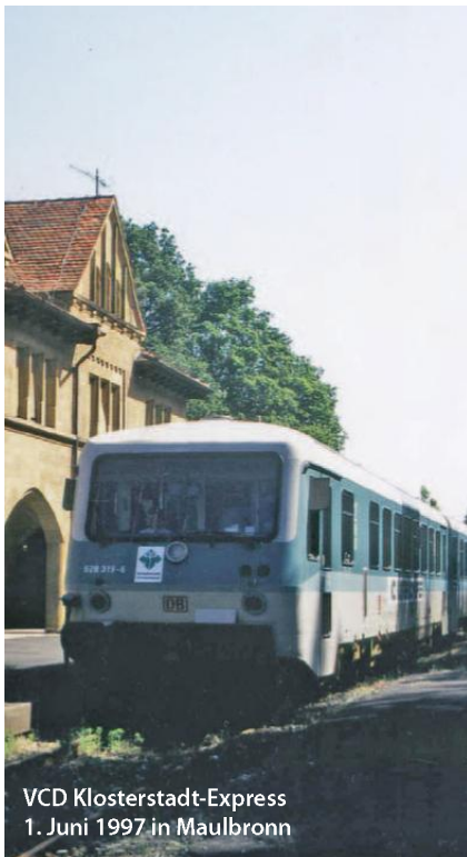
VCD Klosterstadt-Express 1. Juni 1997 in Maulbronn

Nach dem Erfolg der einmaligen Aktion galt es nun zu überlegen, wie die Strecke nach Maulbronn, die aus unerklärlichen Gründen noch nicht offiziell stillgelegt war, zu erhalten ist.