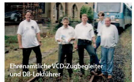
Ehrenamtliche VCD-Zugbegleiter und DB-Lokführer

Das Ergebnis wurde am 9.10.1997 mit der Stadtverwaltung besprochen und es wurde signalisiert, dass sich die Stadt möglicherweise mit bis zu ca. 15.000 DM an einer Fortführung